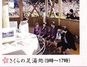
さくらの足湯処 (9時～17時)