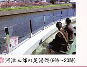
河津三郎の足湯処 (9時～20時)