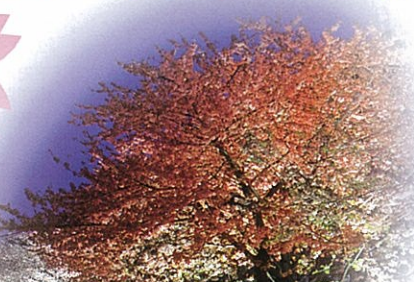
河津浜温泉の夜桜